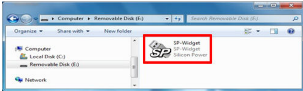
صفحه اصلی SP Widget